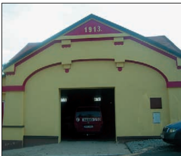
Opravená historická zbrojnice Tisá.