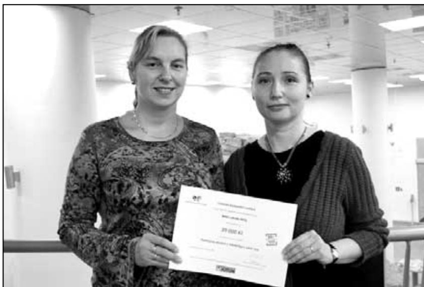
Udělení grantu ÚKN.

Naše MAS byla úspěšná také v získání grantů, a to na již zmiňovaný projekt „Poznejme pověsti z městečka v údolí sov“, dále na projekt „Za historií, kulturou a poznáním do vesnických kostelíků“, získali jsme také dotaci od Ústeckého kraje na projekt „Rozvoj MAS Labské skály“ ke spolufinancování