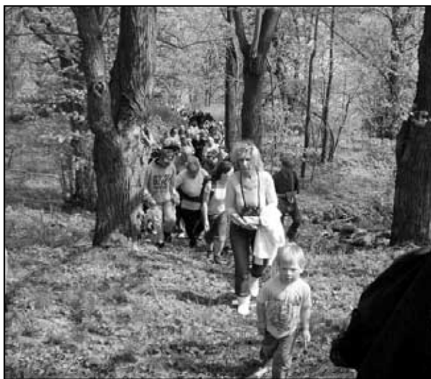
Výstup na Gottesberg.

V letošním roce pokračujeme v propagaci. Snažíme se zapojit nové obce do stávajících aktivit. Letos jsme prezentovali naši MAS např. na 16. Koňském dni ve Slavosově a na Antonínském odpoledni v Lučním Chvojně. 3. Den MAS se tentokrát bude konat v rámci Svatoanenské pouti ve Vemeřicích 3. srpna. Zúčastníme se v Praze výstavy zaměřené na ob-