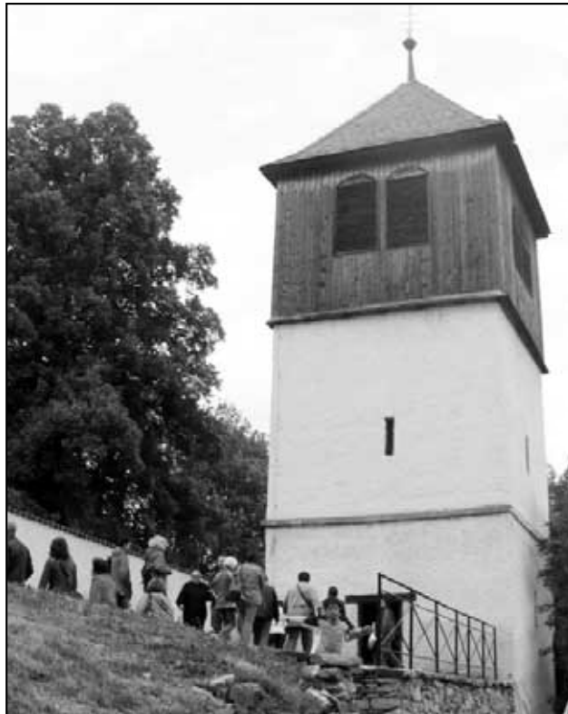
Návštěva zvonice při bývalém kostele v Merbolticích.

novu památek „Máme vybráno“. Stánek MAS s regionálními produkty a propagačními materiály návštěvníci najdou dále na výstavě Země živitelka, na Tolštejnském Krasoděni, na hradě Blansko a na Jílovských slavnostech.