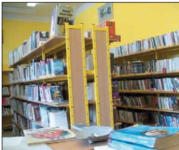
Nová knihovna v Libouchci.