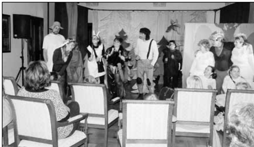
Ochotníci z Tisé

Díky tomuto projektu jsou jednak propagovány regiony obou spřátelených MAS, jednak se zpestřila nabídka akcí pro veřejnost. Spokojenost účastníků a návštěvníků akcí nám potvrzuje, že cíl projektu bude splněn, protože se zvyšuje zájem veřejnosti o regiony MAS Labské skály a MAS Šluknovsko.