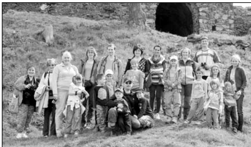
Exkurze na hrad Blansko.

MAS Labské skály, Mírové náměstí 280, 407 01 Jílové, www.maslabskeskaly.cz