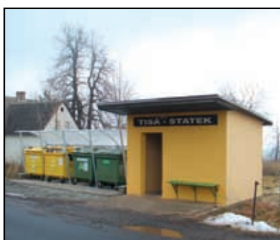
Nové stání na kontejnery Tisá