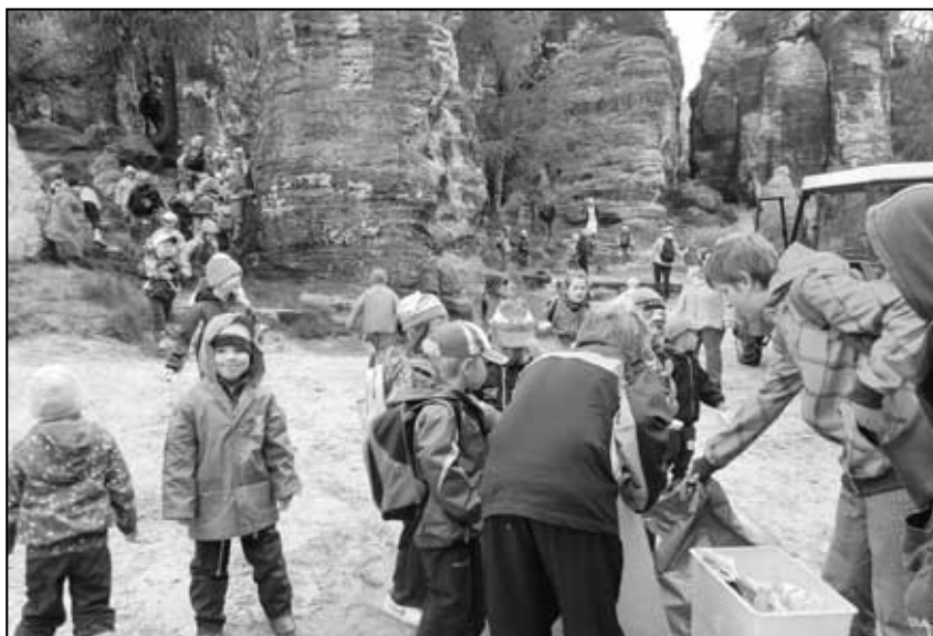
„Sbírání a třídění odpadu“.

MAS vydá v letošním roce aktualizaci cykloturistické mapy, kterou v roce 2006 vydal Mikroregion Labské skály. Mapa se zakreslenými průběhy turistických a cyklistických tras a turistických atraktivit v pohraničí měla velký úspěch, na který bychom chtěli navázat. Novinkou bude seznam realizovaných projektů v rámci PRV v Děčínském a Ústeckém okrese. Dále přibudou průběhy hlavních cyklistických tras pro