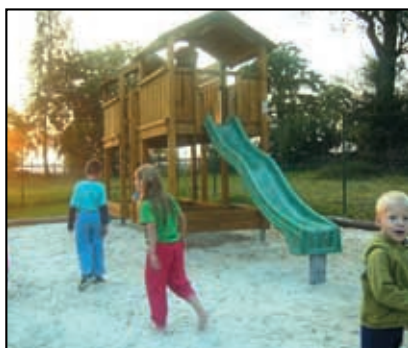
Pláček pro všechny v Lučným Chvojně