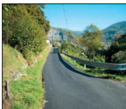
Obnova místní komunikace, Dobkovice