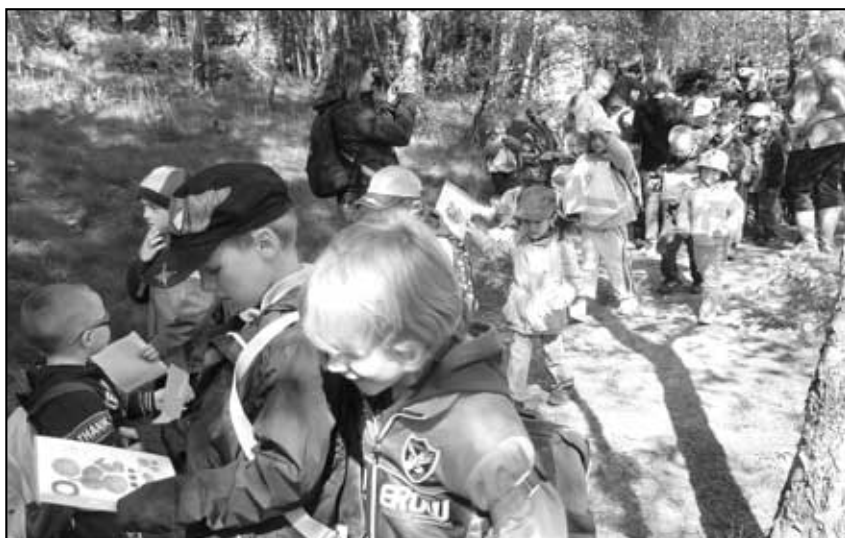
„Co kam patří - stromy a plody“.