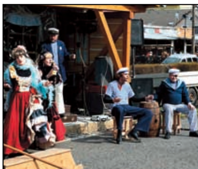
Jarní slavnosti Petrovice