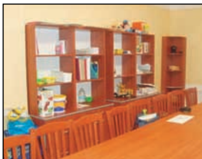
Vybavení pro činnost Mladých hasičů v Libouchci