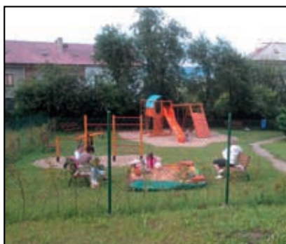
Dětské hřiště v Malšovicích