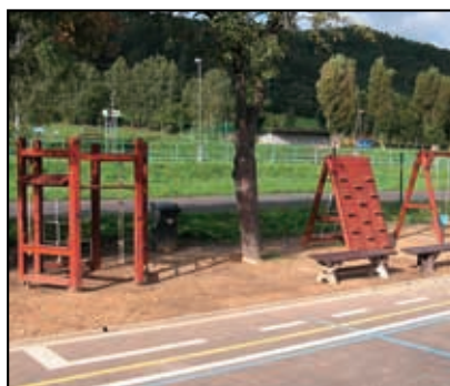
Víceúčelové hřiště Dobkovice