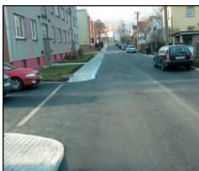
Oprava komunikace v Libouchci