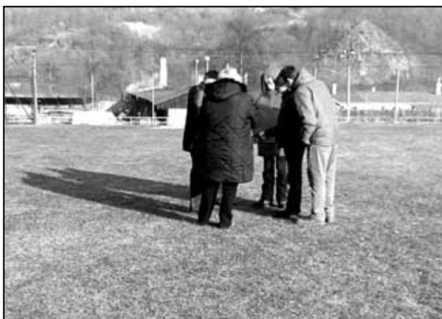
Výběrová komise se radí na místě realizace.