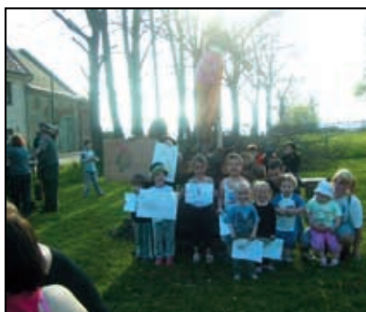
Čarodějnice na Pláčku v L. Chvojně