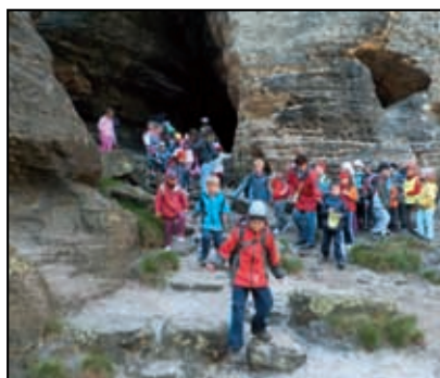
Z aktivit projektu „Radost pro děti“