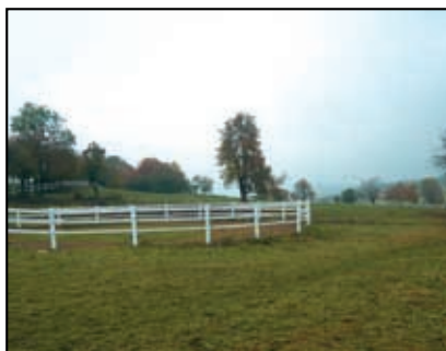
Oplocení jezdeckého areálu v Mnichově