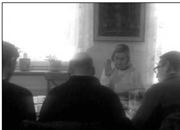
Jednání výběrové komise.