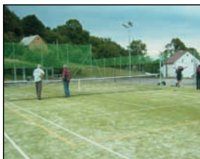
Víceúčelové hřiště v Petrovicích